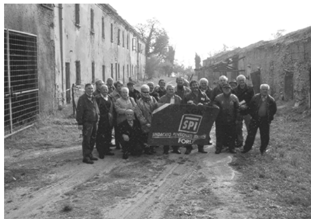
Pensionati di Meldola in gita a Formignano

tutto punto, alla fine della visita, hanno “allestito” un bettolino ( nel ricordo delle miniere dell’800) per una simpatica merenda nell’atmosfera sulfurea, che ancora promana in quel luogo.