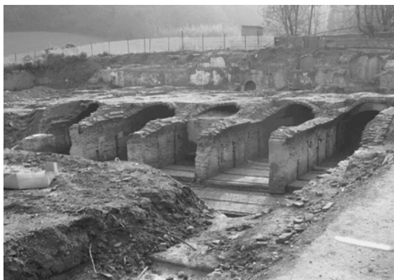
Condotte forzate del molino Palazzo

Qui ci troviamo di fronte ad un manufatto prestigioso, ad una testimonianza unica della prima archeologia industriale; importante quanto la Centuriazione, la Civiltà Contadina e le Miniere di Formignano. Merita inoltre particolare attenzione la particolarità storica, inerente la Compagnia, riguardante la sua condizione statutaria, poiché fin dal primo medioevo aveva suddiviso la proprietà in quote azionarie, alla stregua, se non addirittura anticipando, le innovazioni finanziarie delle signorie fiorentine.